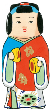
きどはら [佐土原人形]