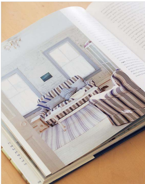
洋書『Pure Style』(1996年刊)の1ページ。“ホワイト”の美しさに気づかせてくれ、その後のわが家のインテリアの道しるべになった本です。

「汚れが目立つのでは?」とよく聞かれますが、ほこりが目立つのはむしろ濃い色で、白のほうが掃除はラクだと、わたしは感じています。ただ、樹脂製品の白は経年で黄ばむので、古さが味わいとなる木、鉄などの素材を選ぶようにしています。