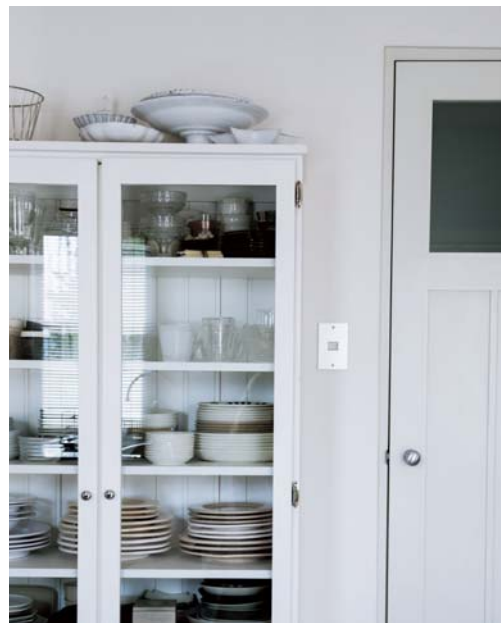
壁はもちろん、食器棚や洗面所の扉も白をセレクトしています。食器棚の印象も白になるよう、色の強い食器はここに入れません。